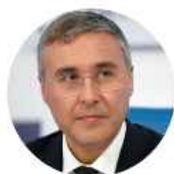
Фальков Валерий Николаевич

Заместитель Председателя Правительства Российской Федерации