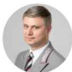
Белозёров Олег Валентинович

Уполномоченный при Президенте Российской Федерации по правам ребёнка