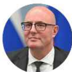
Чернышенко Дмитрий Николаевич

Первый заместитель Руководителя Администрации Президента Российской Федерации