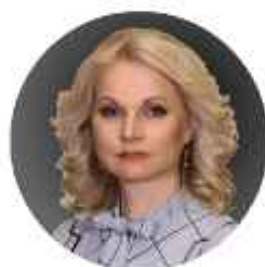
Голикова Татьяна Алексеевна

Заместитель Председателя Правительства Российской Федерации