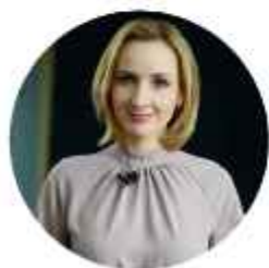
Львова-Белова Мария Алексеевна

Министр здравоохранения Российской Федерации