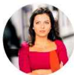
Симоньян Маргарита Симоновна

Генеральный директор - председатель правления открытого акционерного общества «Российские железные дороги»