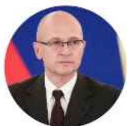
Кириенко Сергей Владиленович

Первый заместитель Руководителя Администрации Президента Российской Федерации