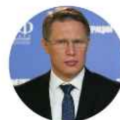
Мурашко Михаил Альбертович

Генеральный директор Агентства стратегических инициатив