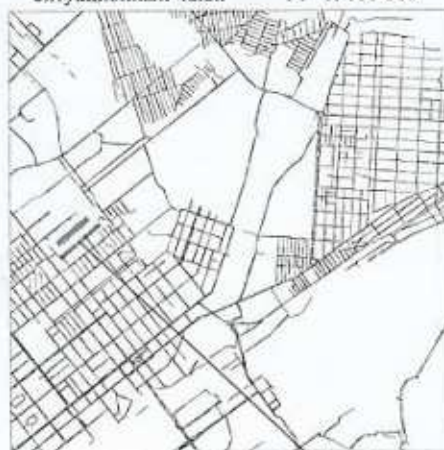
границы испрашиваемой территории