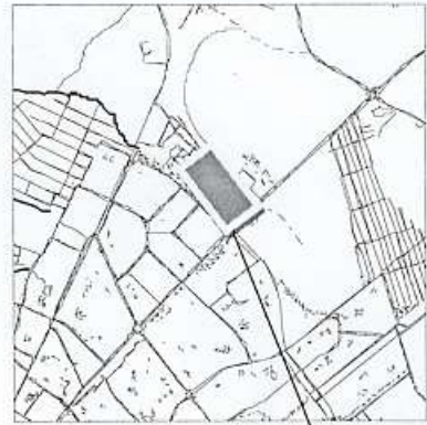
границы испрашиваемой территории