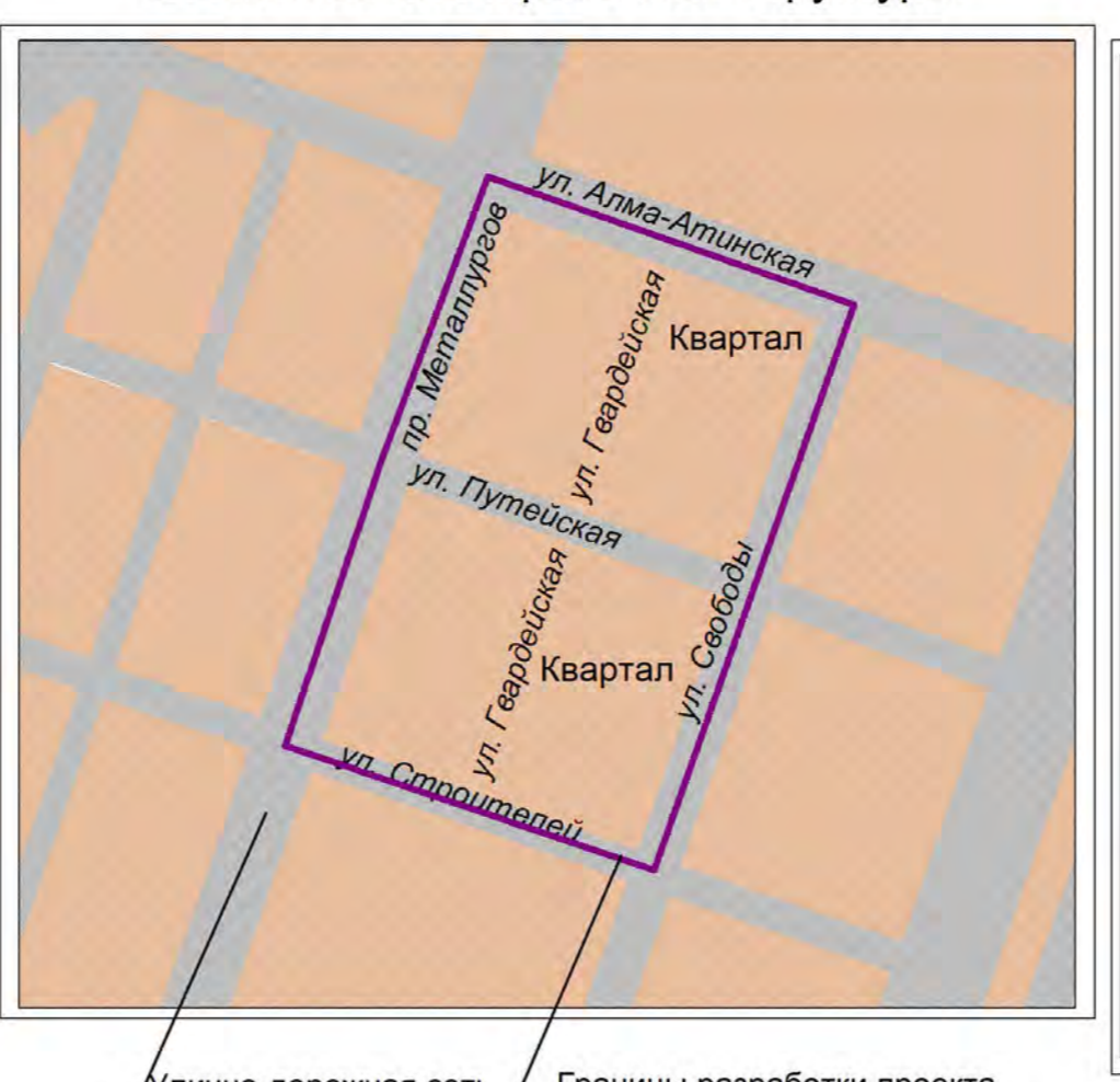
Схема действующих и утверждаемых красных линий