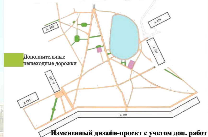
Измененный дизайн-проект с учетом доп. работ